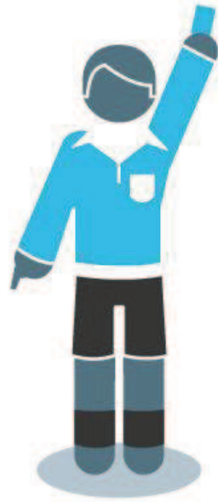
Rode en gele kaarten