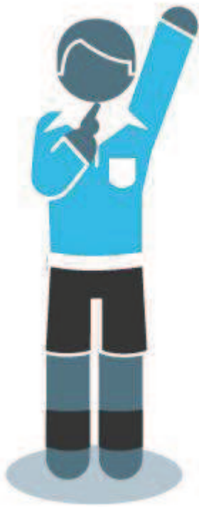
Indirecte Vrije Schop