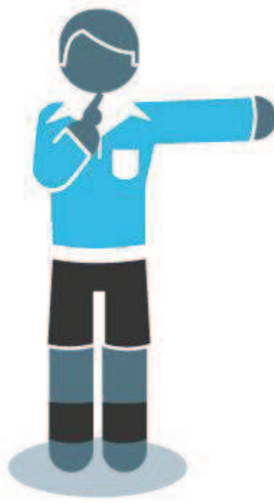
Directe Vrije Schop